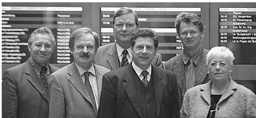
Vorsitzender, stellvertretende Vorsitzende, Obleute