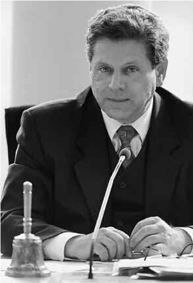
Eduard Oswald, MdB (CDU/CSU – Fraktion) Vorsitzender des Ausschusses für Ver- kehr, Bau- und Wohnungswesen

Geboren am 6. September 1947 in Augsburg; katholisch; verheiratet, zwei Kinder. Wirtschaftsschule, kaufmännische Lehre, Einzelhandelskaufmann. Studium zum Diplombetriebswirt (FH) in München, Studium für das Lehramt an der Universität Augsburg. Hauptschullehrer a. D. Seit 1966 Mitglied der CSU. 1972 bis 1998 Mitglied des Kreistages von Augsburg. 1973 bis 1999 CSU-Kreisvorsitzender im Landkreis Augsburg. 1978 bis 1986 Mitglied des Bayerischen Landtages. Mitglied des Bundestages seit 1987; Mitglied des Vorstands der CDU/CSU-Fraktion, Mai 1992 bis Januar 1998 Parlamentarischer Geschäftsführer; 14. Januar bis 26. Oktober 1998 Bundesminister für Raumordnung, Bauwesen und Städtebau. Vorsitzender des Ausschusses für Verkehr, Bau- und Wohnungswesen seit dem 13. November 1998.