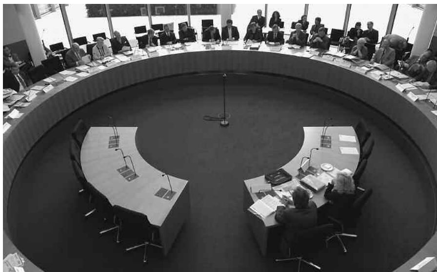
Blick in den Sitzungssaal des Ausschusses