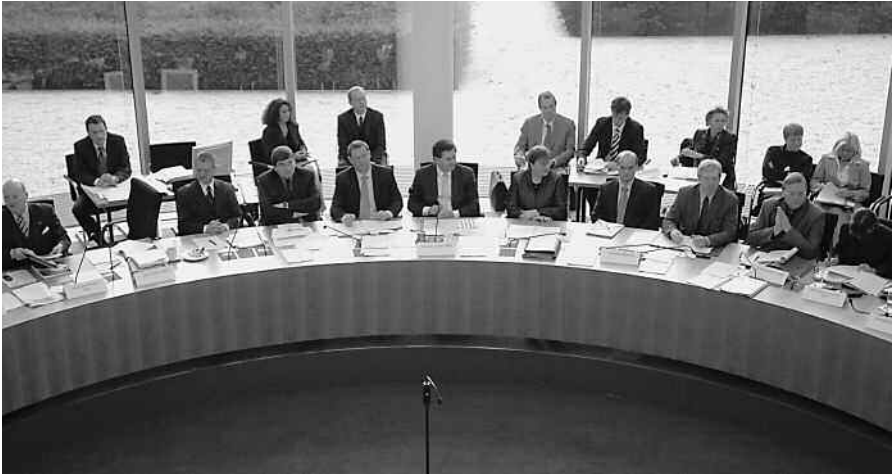
In einer Sitzung