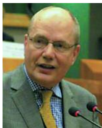
El sueco Göran Lenmårker es presidente de la Asamblea Parlamentaria de la OSCE desde el mes de julio de 2006.

de sus sociedades civiles. Los colaboradores de la Oficina están especializados en la observación de elecciones y disponen de una dilatada experiencia en este terreno. Más de una democracia de reciente creación ha esperado en vano el veredicto "libres y justas", la luz verde de la ODIHR. Pero su labor nunca se agota en la crítica: siempre se acompaña de recomendaciones acerca de lo que habría de cambiarse o mejorarse en la próxima ocasión.