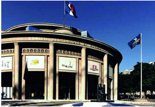
Sede de la Asamblea de la UEO en París.

operó como pacto de asistencia recíproca entre los Estados europeos occidentales para combatir la potencial amenaza que supondría un posible refortalecimiento de Alemania. Se inscribía dentro de una constelación típicamente posbélica y no tardaría mucho en quedar sin encaje. Desde comienzos de la década de los cincuenta Francia promovió la estrecha inserción de la nueva República Federal de Alemania en todas las alianzas posibles.