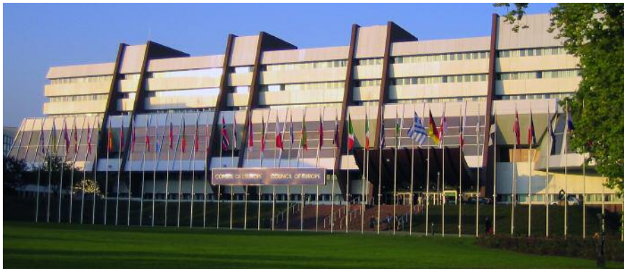
El edificio del Consejo de Europa en Estrasburgo.

hoy en día la Unión Europea subraya sus “valores”, se suele olvidar que la difusión y vigilancia de esos valores ha sido y sigue siendo antes que nada un logro del Consejo de Europa. En muchos países miembros las resoluciones relativas por ejemplo al tratamiento de contenidos difamatorios y hostigantes en Internet o a la admisibilidad de la eutanasia influyen en la legislación nacional. Animosos parlamentarios de Estrasburgo se lamentan a menudo de que su labor apenas tiene eco en la opinión pública, mientras que cualesquiera encuentros a nivel de Jefes de Estado, por muy protocolarios que sean, son considerados cita obligada por la totalidad de la prensa.