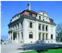
Edificio de la Unión Interparlamentaria.

"La verdadera significación de la UIP no reside tanto en sus resoluciones sino en su función como bolsa de contactos y red de parlamentarios."