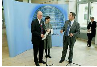
Intérprete en acción durante un encuentro del Presidente del Bundestag, Norbert Lammert, con su homólogo francés Jean-Louis Debré.

Cada vez más diputados comprenden y hablan bien el inglés –tanto entre los alemanes como entre sus interlocutores extranjeros–; el idioma número uno en las conferencias internacionales se convierte en lingua franca mundial. Pero eso no significa que las y los traductores e intérpretes del Bundestag tengan que temer por su empleo, ya que los encuentros internacionales han aumentado aún más que los conocimientos de idiomas.