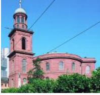
Iglesia de San Pablo de Fráncfort del Meno.

El primer Parlamento panalemán, reunido en 1848 en la Iglesia de San Pablo de Fráncfort, no fue tomado en serio por los gobernantes, sino que todavía hoy en día sufren muchos Parlamentos del mundo. En la época del Imperio el Reichstag pugnó por sus derechos primeramente con el Canciller y después con el Emperador; este tipo de enfrentamientos entre el legislativo y el ejecutivo sigue estando a la orden del día en muchas partes del mundo.