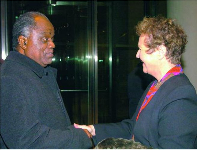
La presidenta del Grupo de Amistad con los Estados de la SADC, Herta Däubler-Gmelin, saluda al Presidente de Namibia, Hifikepunye Pohamba.

vecino, unidos por estrechos lazos de amistad, enfocan de manera diametralmente opuesta. Para mantener un intercambio de pareceres sobre asuntos de esta envergadura difícilmente se encontrará un foro más abierto y a la vez más respetable. Y el Grupo de Amistad Germano-Turco ha contribuido a que el Parlamento turco se convenciera de la necesidad de dictar leyes para mejorar la situación de los derechos humanos. Precisamente ese es el origen de las recientes reformas con las que Turquía se ha preparado para afrontar las negociaciones de adhesión con la Unión Europea.