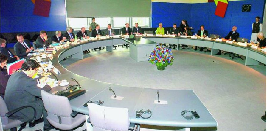
Sesión conjunta de los miembros de las presidencias del Bundestag y de la Assemblée nationale con el presidente del Parlamento francés, Jean-Louis Debré y el presidente del Bundestag, Norbert Lammert.

Las injerencias y confluencias basadas en la confianza mutua también juegan un papel importante en las relaciones interparlamentarias y a veces van mucho más allá de las comparecencias ceremoniales de los Jefes de Estado. La presencia de diputados franceses en una sesión del Bundestag o de sus homólogos alemanes en una sesión de la Assemblée nationale testimonian una especial relación de confianza entre ambos países. También los programas de intercambio para colaboradores parlamentarios son –amén de su considerable utilidad práctica– actos simbólicos que fomentan la confianza recíproca: venid y ved –vienen a decir–, concedemos a alguien que viene de fuera pleno acceso al núcleo mismo de nuestra soberanía nacional.