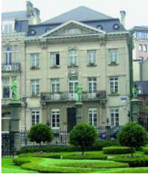
Sede de la Asamblea Parlamentaria de la OTAN en Bruselas.

Si esta iniciativa hubiera partido de la OTAN, fácilmente podría haberse considerado una amenaza a la seguridad del Pacto de Varsovia, con las consiguientes implicaciones. Sin embargo, al ser independientes, los parlamentarios podían ir más lejos que los Gobiernos. Al año siguiente la Asamblea también ofreció una plataforma a las tentativas de desactivar el antagonismo entre Washington y Moscú: El vicepresidente del Estado Mayor General soviético compareció ante una comisión y una delegación de parlamentarios de la OTAN viajó a Moscú para mantener contactos con el Soviet Supremo.