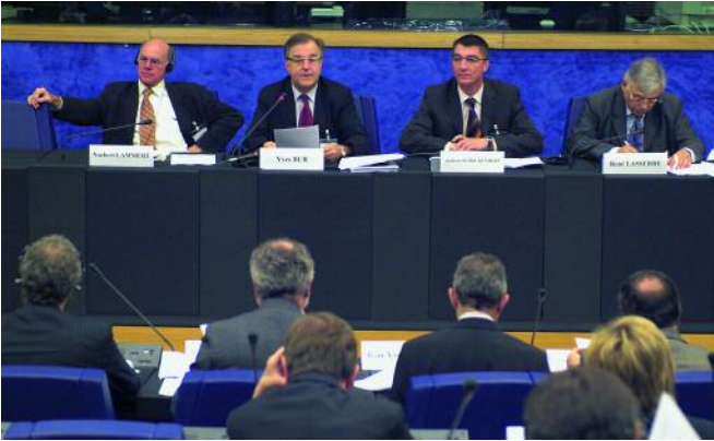
Coloquio París-Berlín del Grupo de Amistad Franco-Alemán sobre “El papel de la asociación franco-alemana en la Europa ampliada”.

güe en virtud del cual los dos Gobiernos decidieron ajustar las bases de dicha institución.