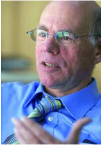
Norbert Lammert, Presidente del Bundestag

"La verdadera significación de la UIP no reside tanto en sus resoluciones sino en su función como bolsa de contactos y red de parlamentarios."