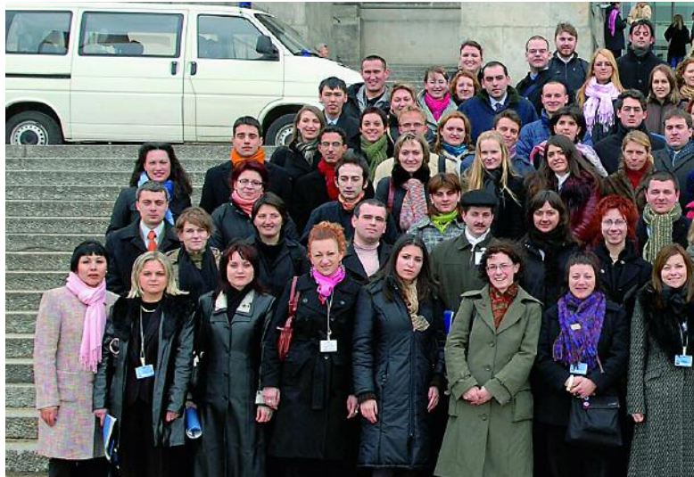
Por fin en Berlín: las y los becarios de las IPP del año 2006 ante el edificio del Reichstag.

en compañía de otros 94 becarios del programa IPP. Durante las primeras seis semanas conoció Berlín y otras ciudades alemanas y asistió a seminarios de estudio organizados por las fundaciones políticas y las tres universidades berlinesas. Luego llegó el momento de trasladar la teoría a la largamente anhelada práctica. En el mes de abril comenzó la parte principal del programa IPP, las prácticas de cuatro meses en el despacho de un diputado del Bundestag.