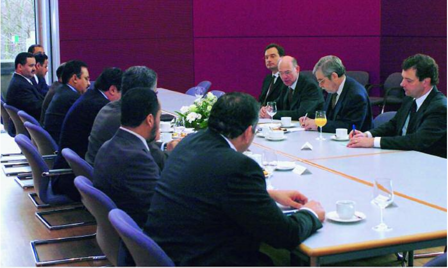
El presidente del Bundestag, Norbert Lammert, recibe a una delegación de la Asamblea Consultiva del Reino de Arabia Saudita.

entre dos Gobiernos crecen si a nivel parlamentario existe un interés recíproco y se conoce en profundidad el sistema político del otro país. De tanto en tanto el Gobierno se sentirá incómodo, porque fácilmente puede surgir la impresión de que se esté contrarrestando su política internacional. Pero a menudo se beneficia de esos contactos, a saber, cuando quiere trasladar un mensaje pero los "canales diplomáticos" habituales están cerrados. Cuando en la década de los sesenta numerosos Estados árabes establecieron relaciones diplomáticas con la RDA y el Gobierno Federal, aplicando su doctrina vigente entonces, a su vez rompió las relaciones con esos países, fueron parlamentarios quienes mantuvieron en pie los contactos con el mundo árabe.