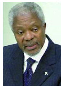
El Secretario General de la ONU, Kofi Annan, durante un discurso pronunciado ante el Bundestag Alemán en febrero de 2002.

Por lo demás, es una de las pocas instituciones en las cuales existe un diálogo periódico entre el Norte y el Sur. Son sobre todo los países en vías de desarrollo los que se benefician del mismo y por tanto prestan especial atención a la UIP. Que la Unión se haya fijado como meta la divulgación del ideal parlamentarista y la difusión de los mecanismos que rigen el funcionamiento de los Parlamentos quizás no sea tan importante para las democracias consolidadas. Empero, ello facilita una transferencia de conocimientos del Norte hacia el Sur y de los países ricos a los pobres que en modo alguno puede darse por descontada. En caso de verse obstaculizados, criminalizados o perseguidos en el desempeño de su labor, los parlamentarios