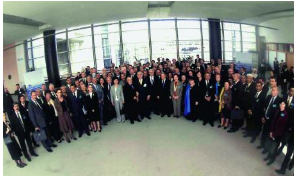
Reunión anual de la Asamblea Parlamentaria Euromediterránea (APEM) en Bruselas en 2006, presidida por su presidente, el español Josep Borrell.

Desde el punto de vista de la asociación entre la región mediterránea y Europa reviste capital importancia el denominado Proceso de Barcelona, que vio la luz en 1995. El término define la cooperación en pie de igualdad entre la UE y los países ribereños del Mediterráneo en los ámbitos de la política y la seguridad, la economía y los asuntos sociales, la cultura y las relaciones interpersonales. Para el año 2010 está previsto que la cooperación desemboque en una zona de libre comercio UE-Mediterráneo. El proceso abarca a Argelia, Egipto, Israel, Jordania, el Líbano, Libia, Marruecos, los Territorios Autónomos Palestinos, Siria y Túnez. Con algunos de estos Estados la UE ya