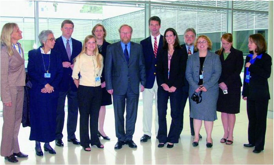
Encuentro del Vicepresidente del Bundestag, Wolfgang Thierse, con un grupo de empleados del Congreso estadounidense en el marco del programa de intercambio parlamentario (MAT).

Dentro de estos programas la administración del Bundestag fija prioridades tanto regionales como temáticas. Hasta el año 1989 los programas estaban centrados exclusivamente en los países de lo que en su día se llamó el Tercer Mundo; a partir de 1990 empezó a dedicarse atención preferente a los países de Europa Central y Oriental (PECO) y a los Estados de la CEI y finalmente, desde 2001, a los países de Europa Sudoriental, a saber, Albania, Bosnia y Herzegovina, Croacia, Macedonia, Serbia y Montenegro así como Kosovo.