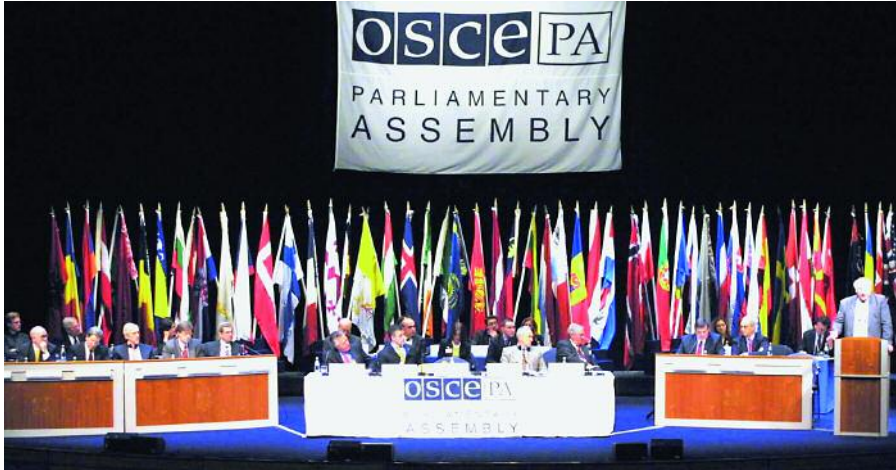
Sesión anual de la Asamblea Parlamentaria de la OSCE.

en la joven y pequeña organización, a la cual pertenecían todas las potencias que tenían o habrían podido tener intereses en los Balcanes. En el año 1992 la CSCE, que así se seguía llamando, fue reconocida por las Naciones Unidas como organismo de ámbito regional. Estableció una Secretaría General en Viena y