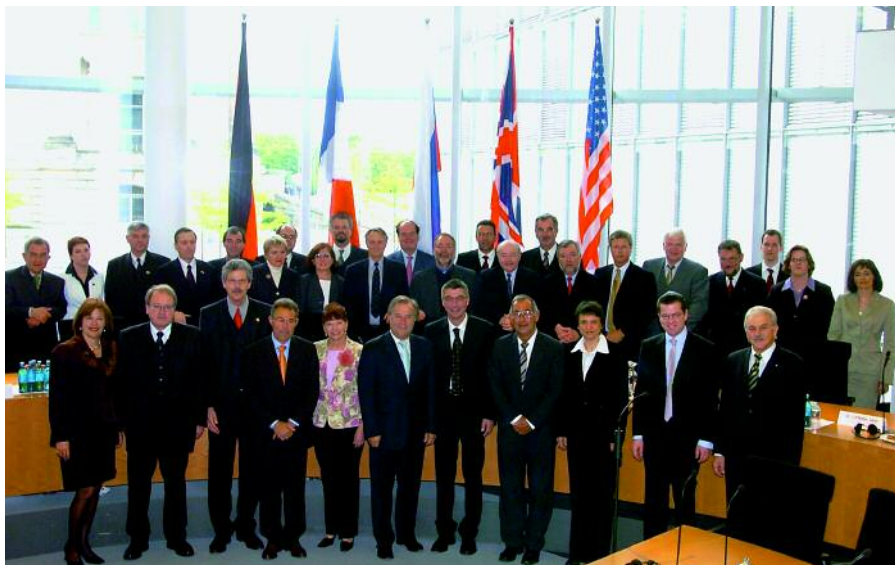
Diputados de Francia, el Reino Unido y la Federación de Rusia durante un acto celebrado en el Bundestag con ocasión del sexagésimo aniversario del final de la Segunda Guerra Mundial.

insustituible. Por ejemplo, en el seno del Grupo de Amistad Germano-Coreano se está estudiando la posibilidad de invitar a parlamentarios de Corea del Norte y Corea del Sur a una sesión conjunta en Berlín para intercambiar experiencias sobre los desafíos y las oportunidades que entraña una reunificación. Pero antes de que un Gobierno pueda dar un paso así transcurre mucho tiempo. También juega un papel importante el diálogo con los parlamentarios de los países islámicos, que se canaliza fundamentalmente a través del Grupo de Amistad con los Estados de lengua árabe de Oriente Próximo, el Grupo de Amistad Germano-Egipcio, el Grupo de Amistad con los Estados del Magreb y el Grupo de Amistad Alemania-Asia del Sur.