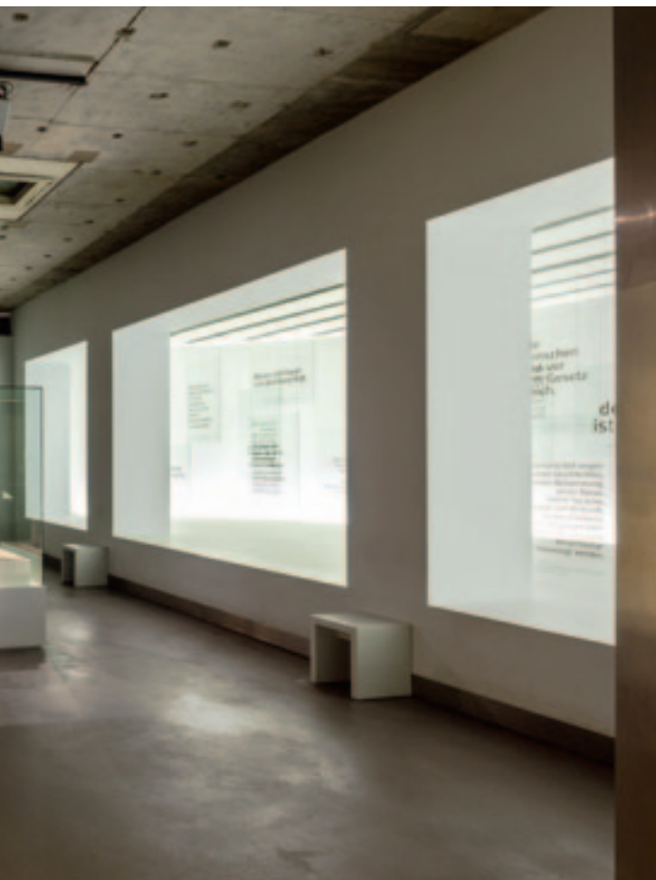
Arriba: Vista del nivel 1 con una maqueta de la Iglesia de San Pablo de Fráncfort del Meno.