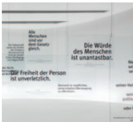
Izqda.: Artículos de la Consti- tución del Imperio Alemán de 1849 y de la Ley Fundamental de 1949 sobre los derechos fundamentales.