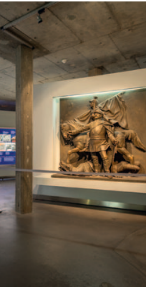
Antiguo monumento de Bismarck en Frankfurt del Meno: El artista Peter Gragert creó esta escultura en 2001 basándose en documentos fotográficos; al fondo paneles dedicados al bloque temático “Del conflicto constitucional prusiano a la Primera Guerra Mundial”.

Versalles y de la hiperinflación, los intensos enfrentamientos internos por la forma de gobierno, las repercusiones de la crisis económica mundial a partir del otoño de 1929 y la problemática posición constitucional del presidente del Reich en el sistema de la Constitución de Weimar, patente sobre todo durante el mandato del presidente Paul von Hindenburg, son los ejes que marcan los años de la República. Bajo el sinónimo de los “Dorados Veinte” se vivió una fase de tranquilidad y estabilidad solo aparentes antes del advenimiento del régimen nazi bajo Adolf Hitler, que condujo a la “catástrofe alemana” (Friedrich Meinecke).