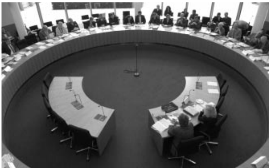
Blick in den Sitzungssaal des Ausschusses