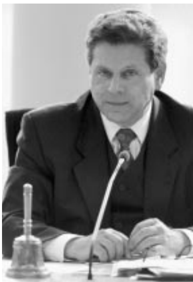
Eduard Oswald, MdB (CDU/CSU – Fraktion) Vorsitzender des Ausschusses für Ver- kehr, Bau- und Wohnungswesen

Geboren am 6. September 1947 in Augsburg; katholisch; verheiratet, zwei Kinder. Wirtschaftsschule, kaufmännische Lehre, Einzelhandelskaufmann. Studium zum Diplombetriebswirt (FH) in München, Studium für das Lehramt an der Universität Augsburg. Hauptschullehrer a. D. Seit 1966 Mitglied der CSU. 1972 bis 1998 Mitglied des Kreistages von Augsburg. 1973 bis 1999 CSU-Kreisvorsitzender im Landkreis Augsburg. 1978 bis 1986 Mitglied des Bayerischen Landtages. Mitglied des Bundestages seit 1987; Mitglied des Vorstands der CDU/CSU-Fraktion, Mai 1992 bis Januar 1998 Parlamentarischer Geschäftsführer; 14. Januar bis 26. Oktober 1998 Bundesminister für Raumordnung, Bauwesen und Städtebau. Vorsitzender des Ausschusses für Verkehr, Bau- und Wohnungswesen seit dem 13. November 1998.