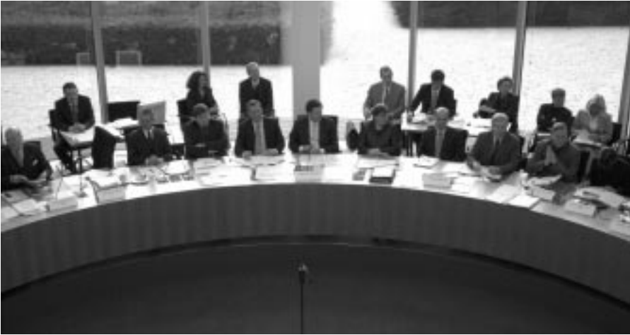
In einer Sitzung