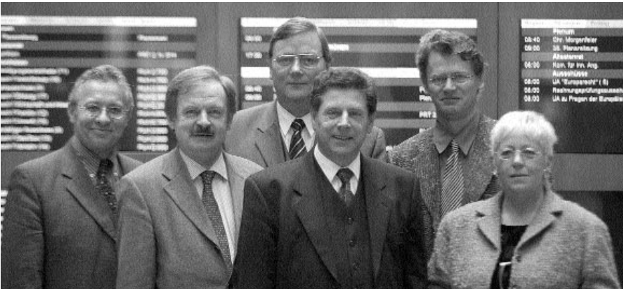
Vorsitzender, stellvertretende Vorsitzende, Obleute