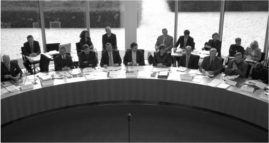
In einer Sitzung