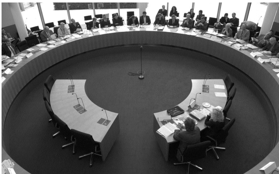
Blick in den Sitzungssaal des Ausschusses