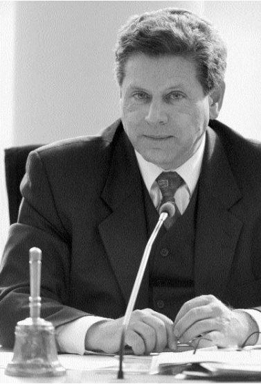
Eduard Oswald, MdB (CDU/CSU – Fraktion) Vorsitzender des Ausschusses für Ver- kehr, Bau- und Wohnungswesen

Geboren am 6. September 1947 in Augsburg; katholisch; verheiratet, zwei Kinder. Wirtschaftsschule, kaufmännische Lehre, Einzelhandelskaufmann. Studium zum Diplombetriebswirt (FH) in München, Studium für das Lehramt an der Universität Augsburg. Hauptschullehrer a. D. Seit 1966 Mitglied der CSU. 1972 bis 1998 Mitglied des Kreistages von Augsburg. 1973 bis 1999 CSU-Kreisvorsitzender im Landkreis Augsburg. 1978 bis 1986 Mitglied des Bayerischen Landtages. Mitglied des Bundestages seit 1987; Mitglied des Vorstands der CDU/CSU-Fraktion, Mai 1992 bis Januar 1998 Parlamentarischer Geschäftsführer; 14. Januar bis 26. Oktober 1998 Bundesminister für Raumordnung, Bauwesen und Städtebau. Vorsitzender des Ausschusses für Verkehr, Bau- und Wohnungswesen seit dem 13. November 1998.