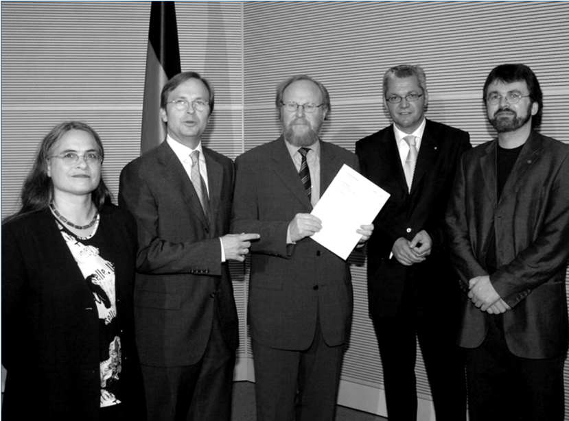
Übergabe des Zwischenberichts an Bundestagspräsidenten Wolfgang Thierse