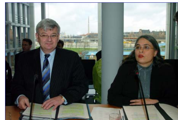
Министр иностранных дел Йюшка Фишер, Криста Никкельс

«Важно, чтобы мы сохранили основное предназначение этого комитета: быть на стороне прав человека. Беря на себя такое обязательство, мы повсюду вступаем на нелегкий путь, так как вызывающая доверие политика в области прав человека начинается также в собственной стране. Мы, например, должны следить за тем, чтобы в рамках борьбы с терроризмом права человека в Германии и Европе воспринимались со всей серьезностью».