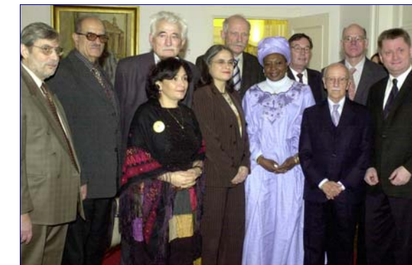
Слушания по вопросу защиты правозащитников

Лейтхойссер-Шнарренбергер, Сабине Leutheusser-Schnarrenberger, Sabine