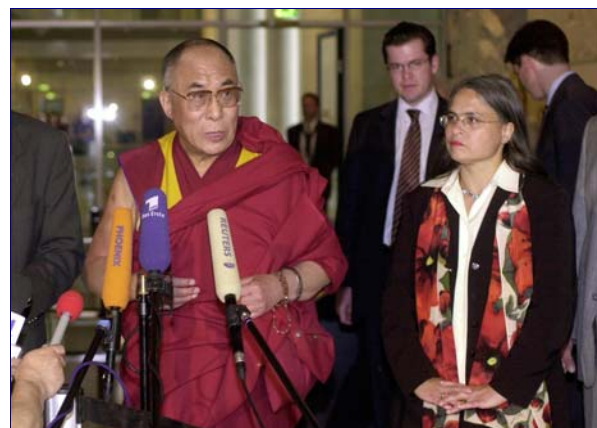
Далай Лама, Криста Никкельс

организациями (НПО). Созданный в 2001 году Германский Институт прав человека, уполномоченный федерального правительства по правам человека и уполномоченный федерального министерства юстиции по правам человека являются надежными партнерами в процессе все большего превращения политики в области прав человека в профильную тему для всех сфер политики.