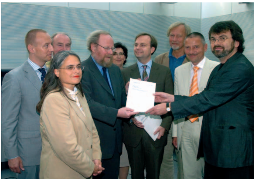
Übergabe des Zwischenberichts an Bundestagspräsident Wolfgang Thierse

von Krankenhaus und ambulanter Versorgung gewisse Einsparpotenziale mobilisieren. Hinzu kommen die Einsparungen durch die vorgeschlagene Änderung der Betäubungsmittel-Verschreibungsverordnung. Demgegenüber sind die Aufnahme der Palliativversorgung in die Möglichkeiten des „zusätzlichen Betreuungsbedarfs“ in der Pflegeversicherung, die Karenzregelung und die Absenkung des Eigenfinanzierungsanteils der stationären Hospize zu nennen, die zu moderaten Kostenausweitungen in einzelnen Sektoren führen können. Die Enquete-Kommission ist überzeugt, dass ein bedarfsgerechter Ausbau der Palliativmedizin und die Förderung der Hospizarbeit maßvolle Kostensteigerungen im Bereich der Begleitung und Versorgung Schwerstkranker und Sterbender rechtfertigen.