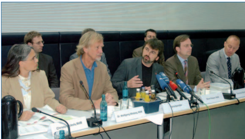
Pressekonferenz anlässlich der Übergabe des Zwischenberichts

Darüber hinaus ist der Aufbau von palliativmedizinischen Konsiliardiensten im Krankenhaus zu fördern, damit Patienten nicht nur auf Palliativstationen angemessene palliativmedizinische Behandlung erhalten, sondern auch auf anderen Stationen von einem palliativmedizinischen Fachteam betreut werden können. Eine finanzielle Krisensituation bis 2007, die zur Verunsicherung und zum Abbau der sowieso knappen Kapazitäten führen würde, ist auf keinen Fall wünschenswert.