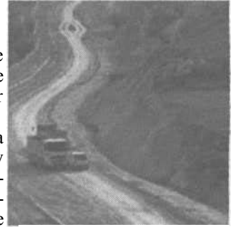
Construction of the Separation Barrier in Jerusalem.

B'Tselem has published an updated map of the Separation barrier. The map delineates the stage of construction in each area and includes a description of the section voided by the High Court. The map can be found on B'Tselem's Website.