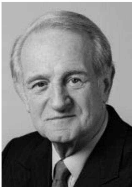
Johannes Rau (SPD) *16.1.1931 Amtszeit: 1.7.1999–30.6.2004