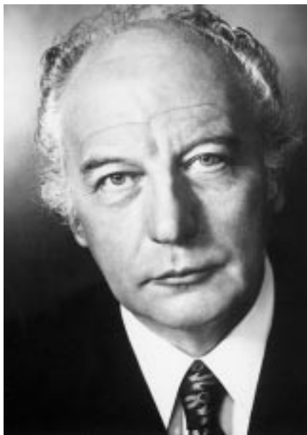
Walter Scheel (FDP) *8.7.1919 Amtszeit: 1.7.1974–30.6.1979