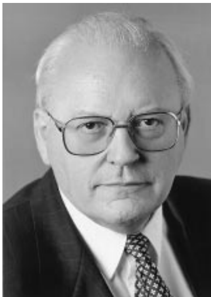
Roman Herzog (CDU) *5.4.1934 Amtszeit: 1.7.1994–30.6.1999