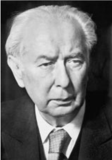
Theodor Heuss (FDP) *31.1.1884, † 12.12.1963 1. Amtszeit: 13.9.1949–12.9.1954 2. Amtszeit: 13.9.1954–12.9.1959