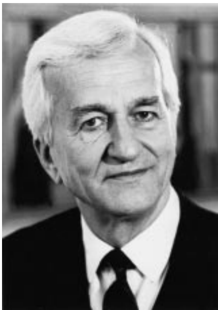
Richard von Weizsäcker (CDU) *15.4.1920 1. Amtszeit: 1.7.1984–30.6.1989 2. Amtszeit: 1.7.1989–30.6.1994