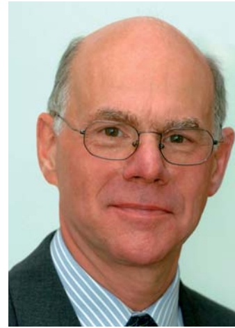
Dr. Norbert Lammert Präsident des Deutschen Bundestages

„Seit über 20 Jahren haben Hunderte junger Menschen aus vielen Ländern Europas und den USA mit einem Stipendium im Bundestag Entwicklung, Organisation und Herausforderungen des deutschen Parlamentarismus kennengelernt. Die unverändert starke Nachfrage aus europäischen und außereuropäischen Ländern belegt die Attraktivität des Programms. Damit leistet das IPS einen wichtigen Beitrag für Völkerverständigung und die Festigung demokratischer Werte.“