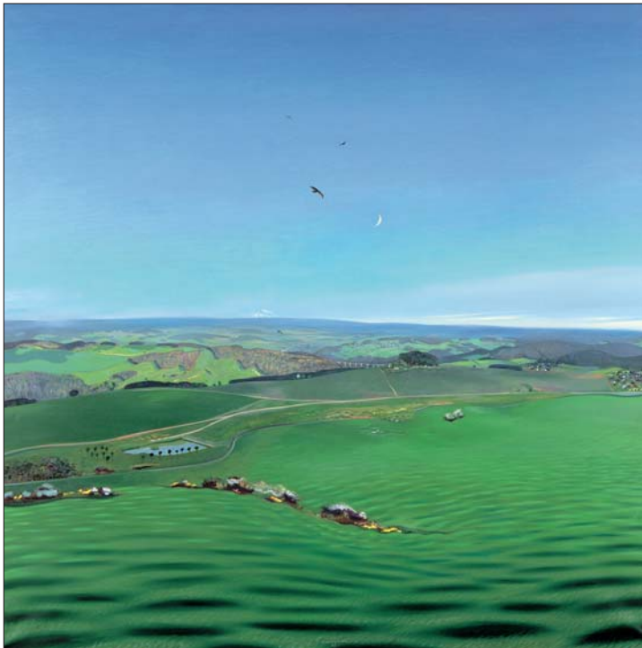
oben: »Das grüne Vogtlandbild«, 1983/1984, Öl auf Leinwand, Peter Ludwig, Aachen, Standort St. Petersburg Titel-Abbildungen: »Panik II«, 1989/1, »Der Eine und die Anderen I«, 1989/5, Öl auf Holz