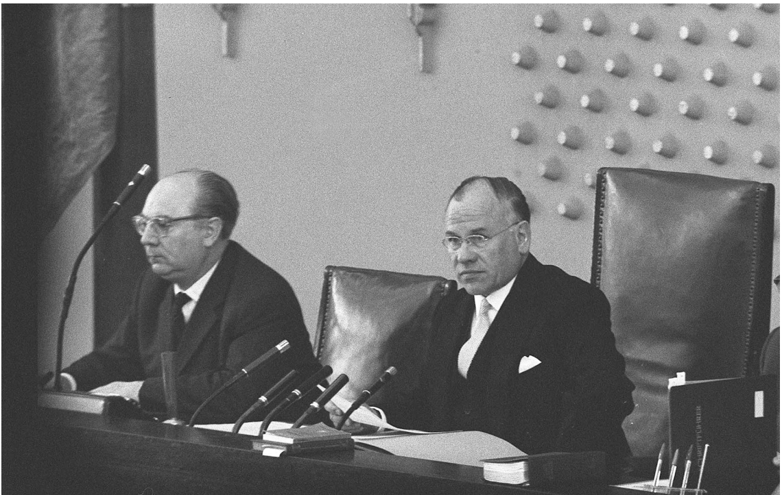
Bundestagspräsident Gerstenmaier leitet die Bundestagssitzung in Bonn, 4. Mai 1960.

Trotz unterschiedlicher Parteizugehörigkeit verband uns Parlamentarier der Nachkriegszeit zumindest eines: unsere Bereitschaft, mit allen uns zur Verfügung stehenden Mitteln einen Beitrag dafür zu leisten, dass die demokratische, rechtsstaatliche und soziale