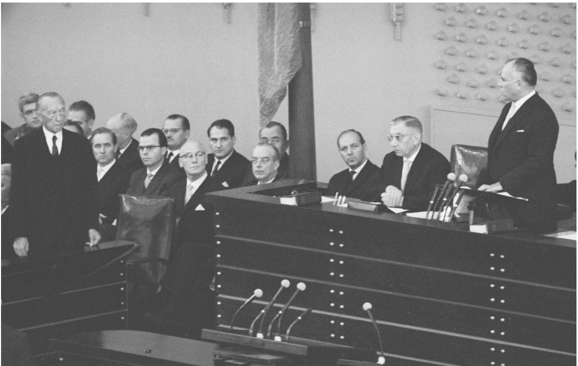
Bundestagspräsident Gerstenmaier würdigt den scheidenden Bundeskanzler Adenauer im Deutschen Bundestag, Bonn, am 15. Oktober 1963.

Bei den Bemühungen Gerstenmaiers um die angemessene Stellung und ein würdiges Bild des Parlamentes ging es nicht um Äußerlichkeiten und Eitelkeiten. Gerstenmaier begriff sich und handelte stets als erster Repräsentant des Parlaments. Aus diesem Selbstbewusstsein und aus seinem Selbstverständnis als Christ, der sich stets als „unter Gott“ stehend begriff – auch dies eine von Gerstenmaier häufig gebrauchte Formulierung –, folgte eine Haltung, die mit dem heute eher selten gewordenen Begriff der Demut benannt werden kann, obwohl sein persönliches Auftreten durchaus selbstbewusst, im Anspruch an das von ihm bekleidete Amt gelegentlich gänzlich undemütig sein konnte. So kann es nicht wundernehmen, dass der „Gefolgsmann Adenauers“ am 12. Januar 1956 dem Bundeskanzler unter anderem mit dem Hinweis zu seinem 80. Geburtstag gratuliert, dass im Parlament zwar die Regierung unseres Staates geboren werde, dass sie in ihm aber nicht regiere, sondern dass