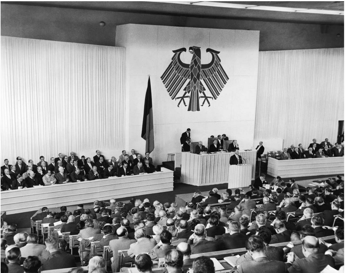
Bundestagspräsident Gerstenmaier leitet die Plenarsitzung des Bundestages am 1. Oktober 1958 in der Technischen Universität Berlin.

Der Vertrag mit Israel fand eine politische Mehrheit – wenn auch die damalige Regierungskoalition keine eigene Mehrheit zustande brachte. Ich darf als Sozialdemokratin