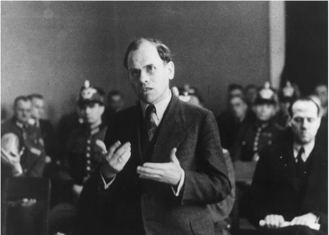
Eugen Gerstenmaier vor dem Volksgerichtshof 1944

Leiter des Evangelischen Hilfswerks und Mitbegründer der Zeitschrift „Christ und Welt“, war stark in der Außen- und insbesondere der Europapolitik engagiert und hatte seit 1953 – als Nachfolger seines Landsmanns Carlo Schmid – das Amt des Vorsitzenden des Ausschusses für Auswärtige Politik inne, ein Amt übrigens, das ihm Freude machte und seinen Interessen sehr entgegenkam. Vielleicht nicht nur, aber auch aus Loyalität gegenüber Konrad Adenauer hatte er sich deshalb zur Kandidatur bewegen lassen und nicht zuletzt wegen seiner bereits des Öfteren unter Beweis gestellten Loyalität gegenüber dem Bundeskanzler wurde Gerstenmaier im November 1954 erst im dritten Wahlgang – und auch dann nur mit 14 Stimmen Mehrheit – zum Bundestagspräsidenten gewählt, sozusagen „mit Ach und Krach“, wie er selber später einmal sagte. Der heute scheinbar selbstverständliche überparteiliche Konsens bei der Wahl von Parlamentspräsidenten war damals alles andere als selbstverständlich. Man kann mit einer gewissen Berechtigung sagen, dass Eugen Gerstenmaier durch seine Amtsführung diese Tradition erst begründet, jedenfalls gefestigt hat.