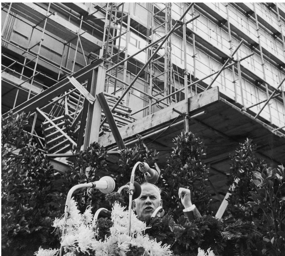
Bundestagspräsident Gerstenmaier beim Richtfest des Abgeordnetenhochhauses in Bonn („Langer Eugen“), 10. Mai 1968

verbessern und die parlamentarische Arbeit den Erfordernissen der Zeit anzupassen. Auch wenn das, was wir als „große Parlamentsreform“ bezeichnen, erst unter seinem Nachfolger von Hassel in Angriff genommen wurde – was von allen Nachfolgern in unterschiedlicher Weise fortgesetzt worden ist –, so hat Gerstenmaier unter anderem durch die Neugestaltung der Fragestunde und die Einführung der Aktuellen Stunde die Informationsrechte des Parlaments gestärkt und zur Belebung der Debatten beigetragen. Außerdem hat er in zähen Verhandlungen alles getan, um die Arbeitsbedingungen der Abgeordneten zu verbessern und etwa zu ermöglichen, dass jedes Mitglied des Deutschen Bundestages ein eigenes Büro bekam. Das mag aus der heutigen Sicht als schiere Selbstverständlichkeit empfunden werden, bedeutete aber unter den Verhältnissen der Nachkriegsjahre einen großen Fortschritt für die Mitglieder des Deutschen Bundestages. Der so genannte Lange Eugen – das Abgeordnetenhochhaus in Bonn, mit dessen Bau 1966 begonnen wurde und das übrigens