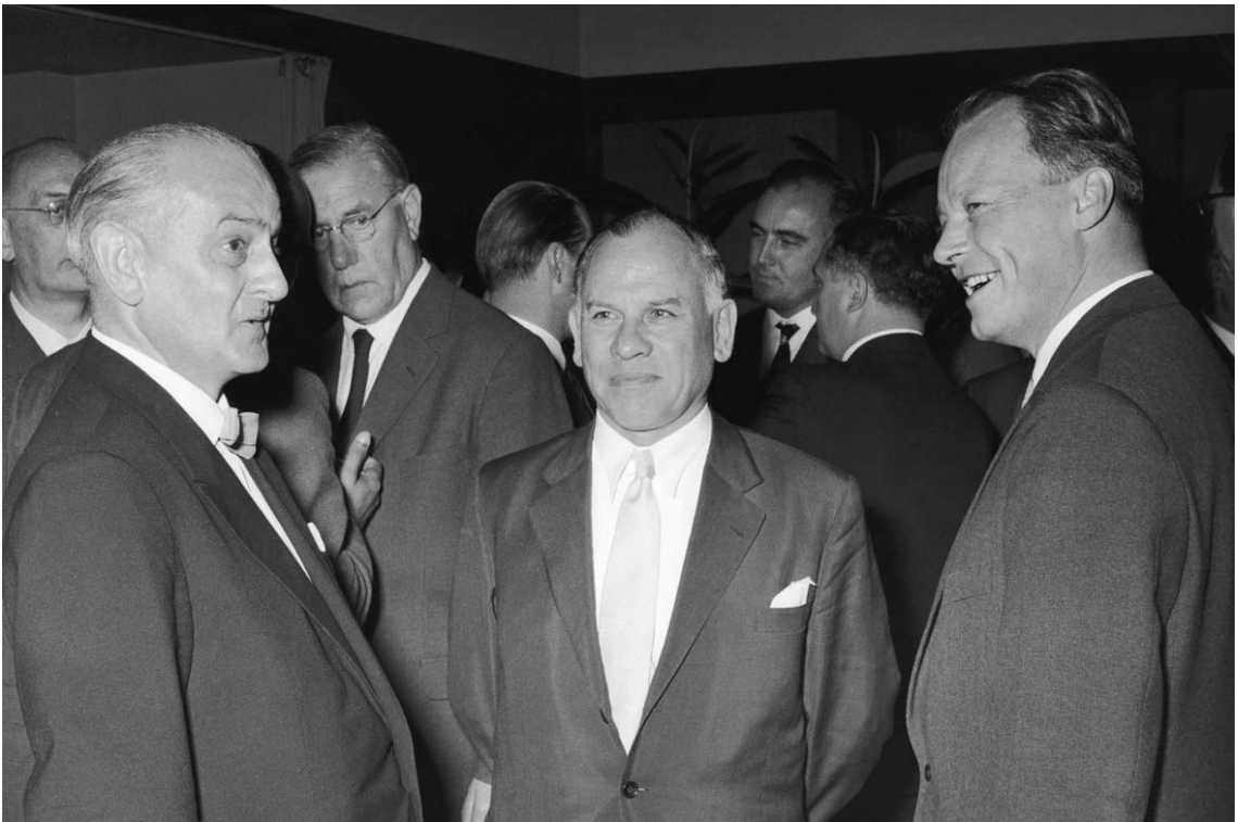
Bundestagspräsident Eugen Gerstenmaier während der Sitzungswoche des Bundestages in Berlin, am 29. September 1958. Links: Heinrich Krone (CDU/CSU), rechts: Willy Brandt (SPD)

Eugen Gerstenmaier hat das, was man als den Bonner Parlamentsstil zu nennen pflegt, entscheidend mitgeprägt. Er hat parlamentarische Fragen aufgeworfen, die auch heute noch aktuell sind, weil sie für die Praxis der Parlamentsarbeit wesentlich bleiben. So lange ich denken kann, hat es immer wieder Kritik an der Auswahl der Abgeordneten und ihrer Arbeit gegeben. Im ersten Deutschen Bundestag haben die wenigen Akademiker, die schon in der Weimarer Republik wichtige parlamentarische und politische Funktionen inne hatten und im Bonner Parlament engagiert handelten, wichtige Akzente gesetzt. Ich erinnere an Hermann Ehlers, Konrad Adenauer, Kurt Schumacher, Carlo Schmid, Theodor Heuss und Thomas Dehler, um nur einige Namen zu nennen. In der Folgezeit verjüngten sich die führenden Persönlichkeiten im Parlament, in Regierung und in der Opposition. Sie alle standen auf dem festen Boden unserer Verfassung, dem Grundgesetz aus dem Jahr 1949, eine Verfassung, die wohl die beste Verfassung ist, die Deutschland je entwickelt hat.