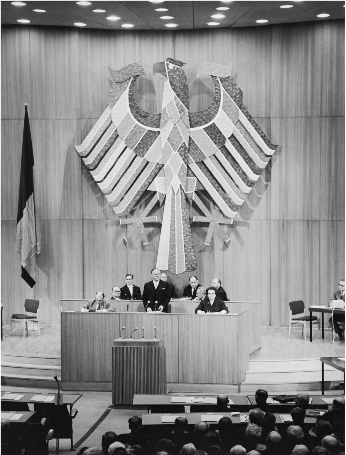
Bundestagspräsident Gerstenmaier eröffnet die Plenarsitzung des Deutschen Bundestages in der Technischen Universität Berlin, 1. Oktober 1958.