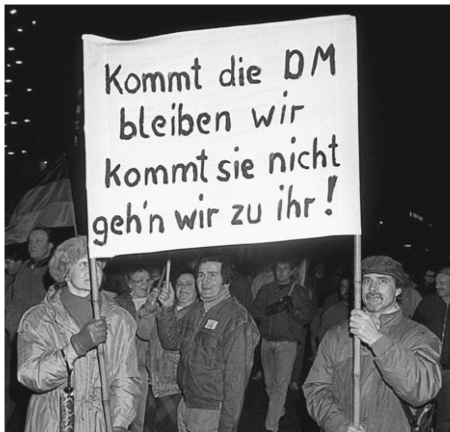
Die Zeichen stehen auf Wiedervereinigung: Montagsdemonstration in Leipzig im Februar 1990

Am 18. März 1990 ist die DDR abgewählt. Gewonnen hat mit 48,15 Prozent das Wahlbündnis Allianz für Deutschland aus der ehemaligen Blockpartei CDU mit Lothar de Maizière an der Spitze, mit der der CSU nahe stehenden Neugründung Deutsche Soziale Union (DSU) und dem Demokratischen Aufbruch: (CDU 40,8, DSU 6,3 und DA 0,9 Prozent). Das Wahlbündnis hatte im Wahlkampf mit Unterstützung der westdeutschen Union unter Bundeskanzler Helmut Kohl für eine schnelle Vereinigung und eine sofortige Einführung der D-Mark geworben. Die SPD, die vor der Wahl als Wahlfavorit galt, kommt auf 21,9 Prozent, der Bund freier Demokraten auf 5,3 Prozent, Bündnis 90, die Listenvereinigung der Bürgerrechtler, die in der Mehrheit einen schnellen Weg zur Einheit ablehnt, erhält 2,9 Prozent der Stimmen. Aus der Vorhut der Revolution ist eine Nachhut geworden. Die Grüne Partei erzielte zwei Prozent und die SED-Nachfolgepartei PDS 16,4 Prozent. Fa-