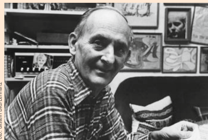
Robert Havemann war eine Stimme der Opposition und Symbolfigur vieler Oppositioneller in der DDR