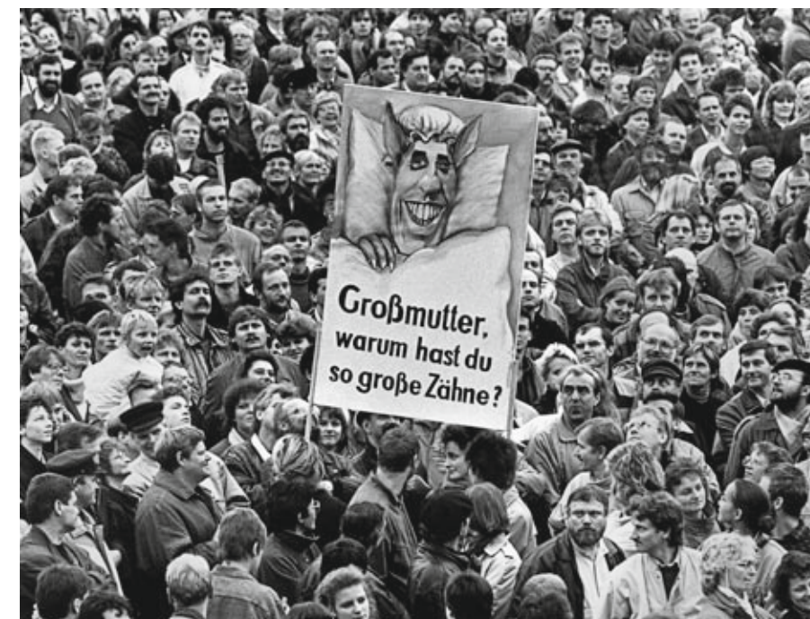
Am 4. November 1989 kommen fast eine Million Menschen zur größten Protestdemonstration gegen die DDR-Führung auf dem Alexanderplatz im Ostteil Berlins zusammen