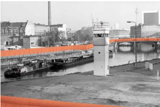
Mauerverlauf 1989: Blick vom Reichstagsgebäude nach Osten (links)