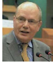
برأس السويدي غلين لينماركر الجمعية البرلمانية للمنظمة منذ يوليو 2006.

ومن العناصر الهامة بالنسبة للديمقراطيات الشابة «مكتب المؤسسات الديمقراطية وحقوق الإنسان» في وارسو التابع للمنظمة والمعني ليس فقط بتطور الدولة وإنما أيضا بتطور المجتمعات المدنية في الدول الأعضاء. العاملون في المكتب يتمتعون بتدريب خاص وخبرة متميزة في مراقبة الانتخابات. وكثيرا ما انتظر العديد من الديمقراطيات الشابة بلا فائدة الحكم القائل «حرة ومنصفة»، أي الضوء الأخضر الذي يعطيه المكتب لشرعية الانتخابات. لكن المكتب لا يتوقف إطلاقا عند النقد وإنما يقدم دائما توصيات حول كيفية تحسين الأمور في الدورة المقبلة.