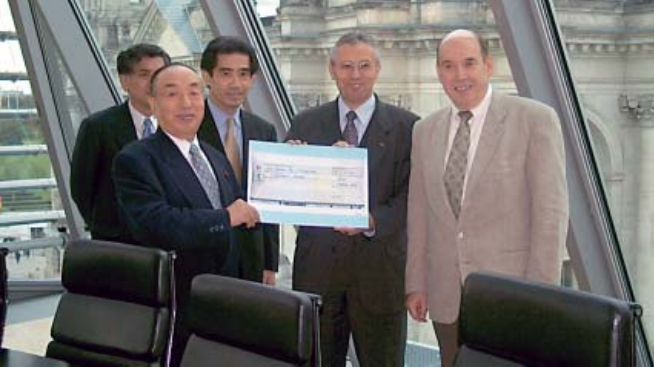
رئيس مجموعة الصداقة اليابانية - الألمانية، يوشيسوغو هارادا، يسلم رئيس المجموعة البرلمانية الألمانية - اليابانية تبرعات النواب اليابانيين لمساعدة ضحايا فيضان نهر أودر عام 2002.

واحدة في ألمانيا في هذه الفترة. وهناك موارد في الميزانية تتيح لهم السفر واستقبال الضيوف. وليس نادرا أن تأخذ الزيارات شكل مؤتمرات صغيرة تتابعها الحكومات باهتمام. وأحيانا ما يحدث أن يفصح رئيس إحدى الحكومات الأجنبية خلال زيارته إلى برلين عن رغبة معينة تبلورت خلال زيارة قام بها النواب.