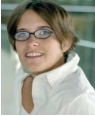
آنا لورمان، عضو البوندستاغ

«تدعم برامج التبادل البرلمانية العلاقات عبر الأطلنطي وتقوي الحوار بين الثقافات. لقد استفدت كثيرا من إقامتي لمدة عام في سيراكيز في ولاية نيويورك، إذا أصبحت أكثر تسامحا وتفتحا واعتدادا بنفسني. وتساعدني إجادتي للغة الإنجليزية بطلاقة في عملي اليومي كنايبة.»