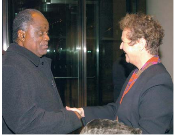
هيرتا دويبلر - غميلين، رئيسة المجموعة البرلمانية لدول الجماعة الإنمائية للجنوب الإفريقي، تستقبل رئيس دولة ناميبيا، هفيكبونيا بوهامبا.

للمجموعات البرلمانية الحق في السفر مرة واحدة خلال الدورة الانتخابية إلى الدولة أو المنطقة الشريكة على ألا يزيد عدد أعضاء الوفد عن سبعة. و بالمقابل يحق لهم أن يدعوا زملائهم الأجانب إلى زيارة