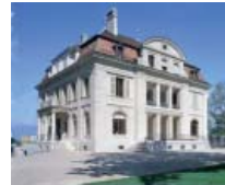
مقر الاتحاد البرلماني الدولي.

«تكمُن أهمية الاتحاد البرلماني الدولي في وظيفته كبورصة للاتصالات وشبكة للبرلمانيين، وليس بالدرجة الأولى في قراراته.»