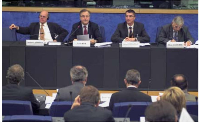
ندوة باريس - برلين، نظمتها المجموعة البرلمانية الألمانية - الفرنسية حول «دور الشراكة الألمانية - الفرنسية في أوروبا الموسعة».

بالرغم من أن العديد من الاتصالات الثنائية كان قد تم تأجيلها في ذلك الوقت. ويستطيع البرلمانيون أيضا عقد اتصالات مع مناطق لا يُعترف بها كدولة، مثال على ذلك تايوان. تنطلق الحكومة الاتحادية من وجود دولة صينية واحدة فقط، ولهذا السبب ليس لها اتصالات رسمية بتايوان. وعلى عكس ذلك فإن البوندستاغ يتضمن «دائرة صداقة برلين - تايبيه» لتبادل الآراء والمعلومات على المستوى البرلماني.