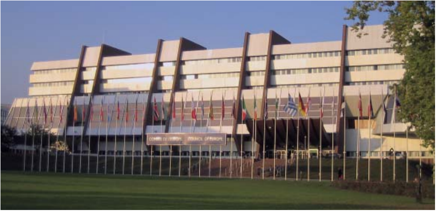
مقر المجلس الأوروبي في ستراسبورغ.

القرارات الخاصة بالمضامين المحرصة في الإنترنت أو السماح بتقديم يد المساعدة لمن على عتبة الموت، والتي انعكست على كثير على القوانين الوطنية في العديد من الدول الأعضاء. وكثيرا ما يشكو البرلمانيون النشطون في ستراسبورغ من أن عملهم بالكاد يلقى اهتماما من الرأي العام - بينما يُعد كل اجتماع لرؤساء الحكومات مهما كان مظهريا، موعدا لا تغفل عنه الصحف.