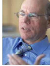
نوربرت لامرت، رئيس البوندستاغ

أعضاء الاتحاد البرلماني الدولي ليسوا النواب وإنما البرلمانات بأكملها. ويرسل البوندستاغ الألماني وفداً من ثمانية نواب إلى اجتماع الربيع وخمسة نواب إلى اجتماع الخريف، ترشحهم الكتل البرلمانية. وينتمي ثلاثة نواب من كل بلد إلى «المجلس الاستشاري»، الذي يعد القرارات. وهناك ثلاث لجان دائمة تجتمع ما بين اجتماعي الجمعية العامة السنويين، مجال عملها السلام والأمن، التنمية والمالية، والديمقراطية وحقوق الإنسان. كما تُنظّم مؤتمرات خاصة تعالج موضوعات حيوية. مقر الاتحاد في مدينة جنيف، عاصمة عصبة الأمم سابقاً. ولأول مرة نظم الاتحاد البرلماني الدولي في عام 2000 المؤتمر العالمي لرؤساء البرلمانات، تلاه المؤتمر الثاني في عام 2005، وتقرر إجراؤه بشكل دوري.