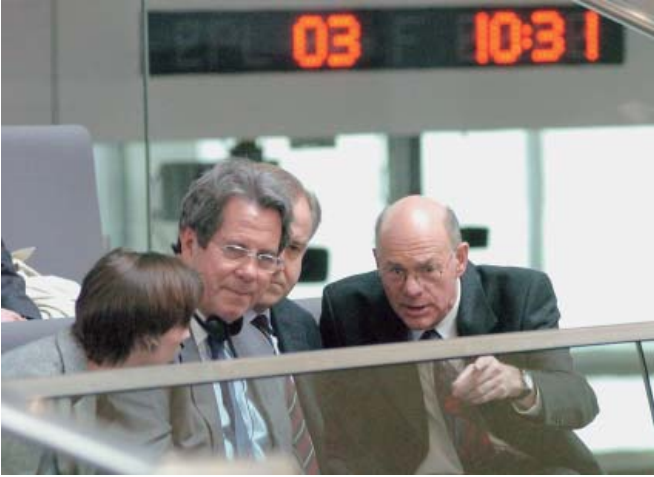
جان - لويس ديبيري، رئيس الجمعية الوطنية الفرنسية مع زميله الألماني نوربرت لامرت خلال انعقاد جلسة من جلسات البوندستاغ.

لكن حتى لو لم تكن للعلاقات الدولية تداعيات على المستوى الوطني، فإنها أكثر أهمية وقرب من أن نتركها للحكومات وحدها. فالتاريخ يثبت أن الحكومات كثيرا ما تعمل على مستوى الحكومة من حيث أنها مؤسسة فقط. لكن بإمكان البرلمانيين أن يشرعوا في علاقات أكثر تنوعا تدعم السلام أو حتى أن يعقدوا علاقات من جديد، حتى ولو أصبح ذلك مستحيلا بين الحكومات. وكثيرا ما سبقت التخفيف من حدة التوتر لقاءات على المستوى البرلماني. الاهتمام المتبادل والمعرفة الدقيقة بالنظام السياسي في البلد المعني على مستوى البرلمان يرفعان من فرص التوصل إلى اتفاق سياسي حال وجود نزاع بين الحكومات. وقد تستاء الحكومة من ذلك أحيانا، إذ قد ينشأ بسهولة الانطباع بأنه يعاكس سياستها الدولية. لكنها غالبا ما تستفيد من مثل هذه الاتصالات عندما تريد مثلا أن تنقل رسالة، وتجد «القنوات الدبلوماسية» المعتادة