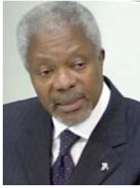
كوفي أنان، الأمين العام للأمم لمنظمة الأمم المتحدة يلقي خطابا في البوندستاغ في فبراير عام 2002.

الأولى من القرن العشرين، نصت على الأقل على قواعد حال اندلاع الحروب، مثال على ذلك لائحة لاهاي الخاصة بالحروب البرية في عام 1907. لكن لم تتأسس محكمة تحكيم تتوسط بين الحكومات إلا بعد كارثة الحرب العالمية الأولى. وكان بعض من البرلمانيون هم الذين ناضلوا بلا هوادة في سبيل مثل هذه المؤسسة وأنجزوا الأعمال التحضيرية الفكرية والسياسية الضرورية لتأسيسها.