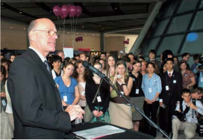
يستقبل نوربرت لامرت، رئيس البوندستاغ، في المؤتمر الإعلامي للشباب 600 مشارك و370 صاحب منحة من الولايات المتحدة الأمريكية في البرلمان.

الاتفاقية بمناسبة الذكرى الثلاثمائة لأول موجة هجرة من ألمانيا إلى «العالم الجديد» – ويقال أن خمسين مليوناً من الأمريكيين من أصل ألماني. وبالطبع أن البرنامج يرمي إلى التأكيد على تراث العلاقات الجيدة بين البلدين.