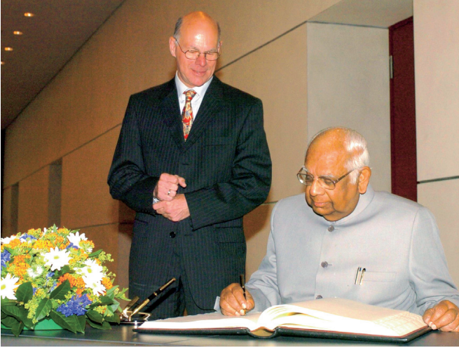
نوربرت لامرت، رئيس البيوندستاغ وسومنت تشاترجي، رئيس برلمان الهند

ويحتل تبادل الآراء على شكل حلقة نقاش وتعميق التعاون وبعض من الرمزية المكانة الأولى عندما يلتقي رؤساء البرلمانات في الدول الأعضاء في المجلس الأوروبي والجمعيات الأوروبية في ستراسبورغ أو دولة عضو أخرى ليعقدوا مؤتمر رؤساء البرلمانات «الكبير». تحديدا الديمقراطيات الشابة في شرق أوروبا كثيرا ما تواجه بمسائل جديدة عليها في هذا الإطار.