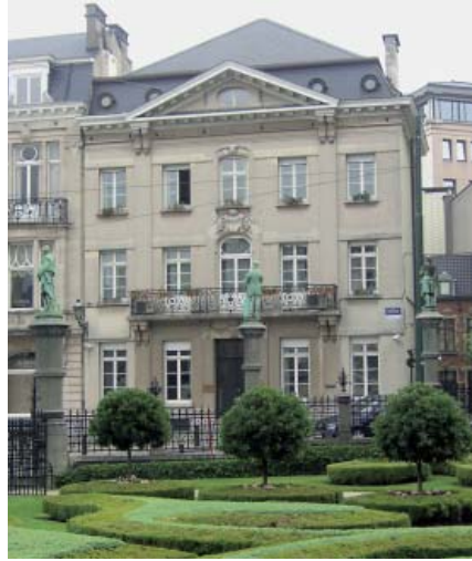
مقر الجمعية البرلمانية لحلف الأطلسي في بروكسل

www.bundestag.de/internat/interparl_orga/index.html