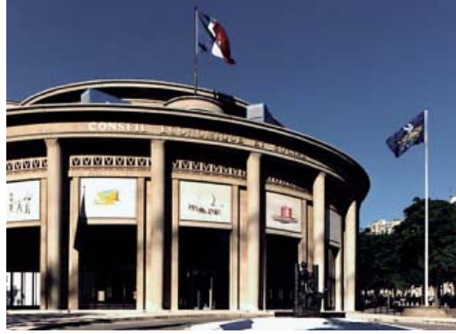
مقر الجمعية البرلمانية لاتحاد دول غرب أوروبا في باريس.

ضد التهديد المحتمل الذي قد تشكله ألمانيا تقوى شوكتها مستقبلا. كان الاتحاد هيكلا نبع من معطيات حقبة ما بعد الحرب. وبعد فترة قصيرة لم يعد يتناسب والمشهد العام. فلقد اجتهدت فرنسا منذ بداية الخمسينات في دمج جمهورية ألمانيا الاتحادية الجديدة في مختلف التحالفات. كان هذا يسري أيضا على مجال السياسة الأمنية: في عام 1954 أبرم الألمان بالاشتراك مع الأوروبيين الغربيين معاهدة بروكسل المعدلة. وتتضمن في مادتها المحورية، المادة الخامسة، التزاما بالدعم الحربي المتبادل في حالة الهجوم من الخارج. في الأصل كانت الحكومة الفرنسية تهدف إلى دفع عملية الاندماج أبعد من ذلك بكثير، ودمج الجيوش في غرب أوروبا بما فيها الجيش الألماني، في جيش أوروبي واحد باسم «جماعة الدفاع الأوروبية». لكن ذلك لم يتم لاعتراض الجمعية الوطنية الفرنسية عليه. نتجت معاهدة بروكسل المعدلة واتحاد دول غرب أوروبا بشكله الحالي عن مأزق. بعد فشل مشروع جماعة الدفاع الأوروبية كانت هناك رغبة في الحفاظ أقل شئ على الالتزام بالدفاع المتبادل. ولم تضطلع المنظمة بدور حربي. فقد كان حلف الأطلسي وعضوه المهيمين الولايات المتحدة هو الذي ربط عام 1955 ألمانيا ببنى الدفاع الغربية.