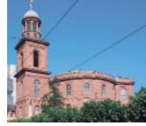
كنيسة القديس بولس في فرانكفورت.

يواجه البرلمانيون في جميع أنحاء العالم مشاكل مشابهة ولهم مصالح «زميلة». وليس بالضرورة أن يتعلق الأمر بالقضايا الديمقراطية الأساسية. فمن المشاكل التي تعني جميع البرلمانات قضية اختيار المعلومات وتوزيعها، ما يتم اليوم غالبا بالوسائل الإلكترونية. ما كم المعلومات الذي يحتاجه النائب اليوم ليتخذ قرارا مسؤولا؟ ما هو الحد الأقصى الذي يجب أن يكون في متناوله كي لا يغرق في بحر من التفصيلات؟ ماذا يستطيع نواب البوندستاغ أن يتعلموه من أعضاء الكونغرس الأمريكي في هذا الصدد؟ هذا بعض من الأسئلة التي تلعب دورا في الحوار البرلماني البيني.