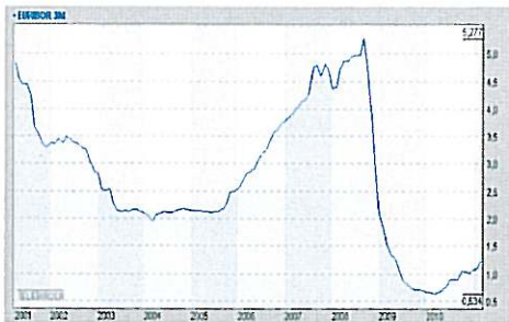
3-M-Euribor – 10 Jahre