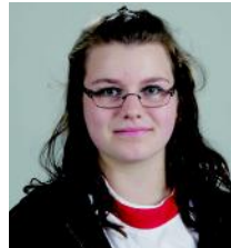
Titel: Anne Frank, 1941