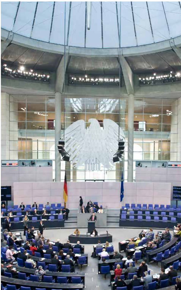
Blick in den Plenarsaal im Reichstagsgebäude.