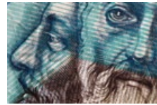
54 Slowakei: 50 Kronen, 2005: Kyrill und Method, die Brüder Konstantin (um 827–869) und Michael (um 815–885) aus Thessaloniki, christliche Missionare, entwickelten das kyrillische Alphabet.