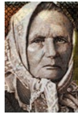
39 Litauen: 1 Litas, 1994: Porträt Žemaitė, eigentlich Julija Beniūše-Zymantiėne (1845–1921), Schriftstellerin, aktiv in der litauischen Unabhängigkeitsbewegung.