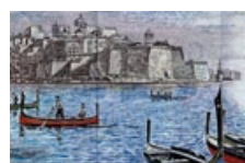
43 Malta: 10 Lire, 1967: Valletta, Grand Harbour.