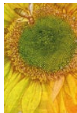
45 Niederlande: 50 Gulden, 1982: Sonnenblume.