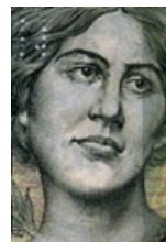
57 Tschechische Republik: 2000 Kronen, 2007: Ema Destinová (1878–1930), Sopranistin.