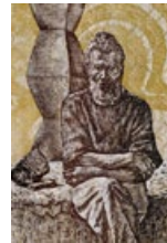
52 Rumänien: 500 Lei, 1991: Constantin Brăncuși (1876–1956), rumänisch-französischer Bildhauer.