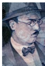
50 Portugal: 100 Escudos, 1987: Porträt Fernando Pessoa (1888–1935), Lyriker und Schriftsteller.