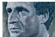
56 Spanien: 10000 Peseta, 1985: Porträt Juan Carlos I. (geb. 1938), seit 1975 König von Spanien.