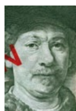
44 Niederlande: 1000 Gulden, 1956: Rembrandt van Riyn (1606–1669).