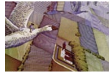
53 Schweden: 20 Kronen, 1997: Zu Selma Lagerlöf (1858–1940): Die wunderbare Reise des kleinen Nils Holgersson mit den Wildgänsen. recto: Porträt der Autorin.