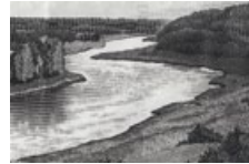
38 Lettland: 10 Latu, 1992: Der Fluss Daugava (dt. Düna, russ. Dwina).