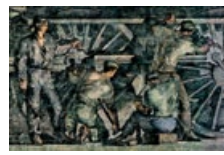
37 Jugoslawien: 100 Dinar, 1953: Arbeiter an einer Lokomotive.