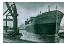
30 Großbritannien: 1 Pfund, Clydesdale and North of Scotland Bank, 1963.