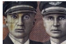
40 Litauen: 10 Litu, 2001: Steponas Darius (1896–1933) und Stasys Girėnas (1893–1933) überflogen 1933 nonstop den Atlantik, stürzten jedoch bei Kuhdamm (heute Psczelnik, Polen) ab.