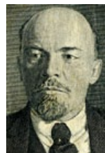
58 UdSSR: 100 Rubel, 1947: Porträt Wladimir Iljitsch Lenin, eigentlich Uljanow (1870–1924), kommunistischer Politiker, marxistischer Theoretiker, Begründer der Sowjetunion.