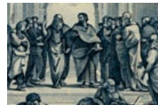
33 Italien: 500.000 Lire, 1997: Nach Raffael (1483–1520), Die Schule von Athen, 1511, Fresko im Vatikan, Rom.