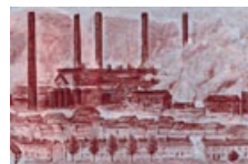
41 Luxemburg: 100 Francs, 1956: Stahlindustrie in Differdange (Differdingen) im Süden Luxemburgs.