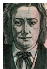
55 Slowenien: 1000 Tolarjew, 2005: Porträt France Preseren (1800–1849), slowenischer Dichter.