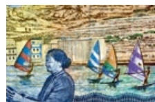
42 Malta: 5 Lire, 1986: Surfer von Mellieha Bay und Netzflickerin.