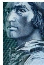
51 Portugal: 2000 Escudos, 1995: Bartolomeu Dias (1450–1500), portugiesischer Seefahrer und Entdecker.