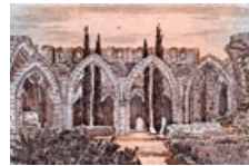
60 Zypern: 1 Pfund, 1992: Kyrenia, gotische Abtei Bellapais, ehemaliges Prämonstratenser-kloster.

Ulrich Wüst Fotografien 7. Mai – 31. August 2012