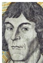
49 Polen: 1000 Zloty, 1982: Nikolaus Kopernikus (1473–1543).