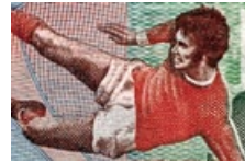
31 Großbritannien: 5 Pfund: Fußballspieler (Georg Best).