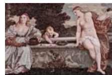
34 Italien: 20 000 Lire, 1975: Nach Tizian (1488/90–1576), Himmlische und Irdische Liebe, 1515, Paris, Louvre.