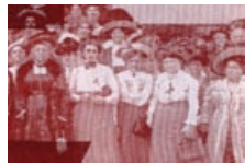
46 Österreich: 500 Schilling, 1997: Teilnehmerinnen des Bundestages Österreichischer Frauenvereine in Wien 1911. recto: Porträt Rosa Mayreder (1858–1938), Schriftstellerin und Frauenrechtlerin.