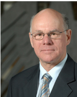
Prof. Dr. Norbert Lammert Präsident des Deutschen Bundestages

Ich wünsche Ihnen aufschlussreiche Stunden im Deutschen Bundestag.