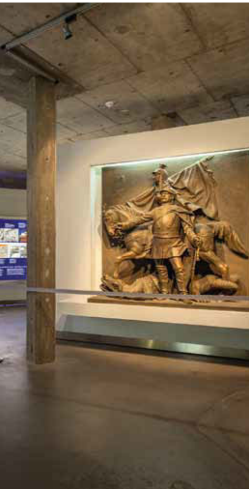
Ehemaliges Bismarck-Denkmal in Frankfurt am Main: Der Künstler Peter Gragert schuf diese Plastik 2001 nach historischen Fotodokumenten; im Hintergrund Ausstellungstafeln zum Themenblock „Vom preußischen Verfassungskonflikt bis zum Ersten Weltkrieg“.

des Versailler Vertrags und der Inflation, heftige innenpolitische Auseinandersetzungen über die Staatsform, die Folgen der Weltwirtschaftskrise ab Herbst 1929 und die problematische Stellung des Reichspräsidenten in der Verfassung von Weimar, die vor allem unter Reichspräsident Paul von Hindenburg offenkundig wurde, bestimmten