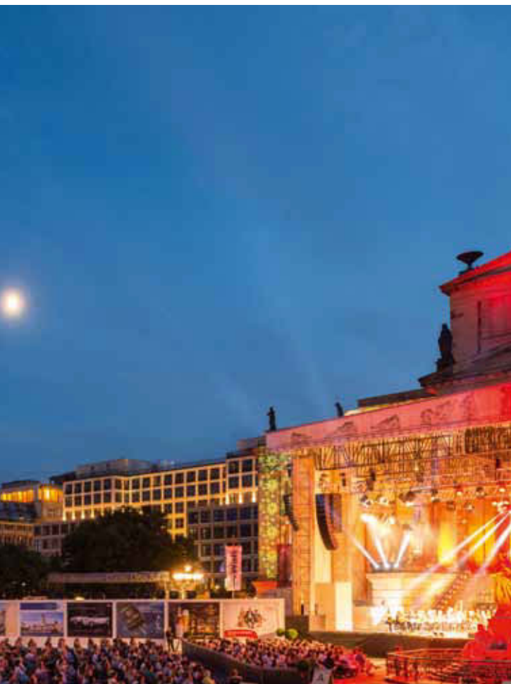
Der Deutsche Dom auf dem Gendarmenmarkt in Berlin, illuminiert anlässlich des 23. Classic Open Air Festival, im Juli 2014.