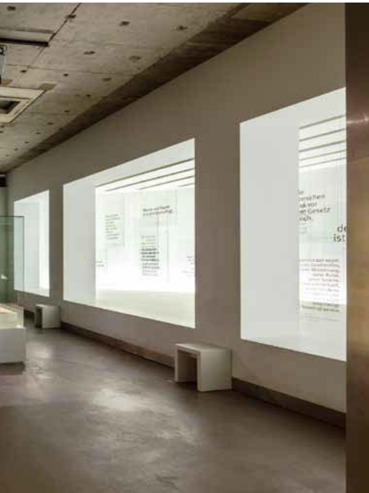
oben: Blick in die Ebene 1 mit einem Modell der Frankfurter Paulskirche.