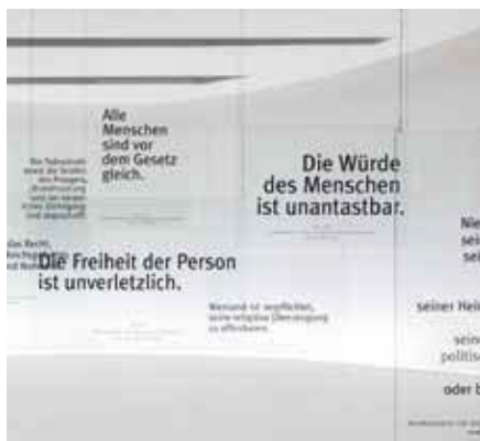
links: Artikel der Verfassung des Deutschen Reiches von 1849 und des Grundgesetzes von 1949 zu den Grundrechten.