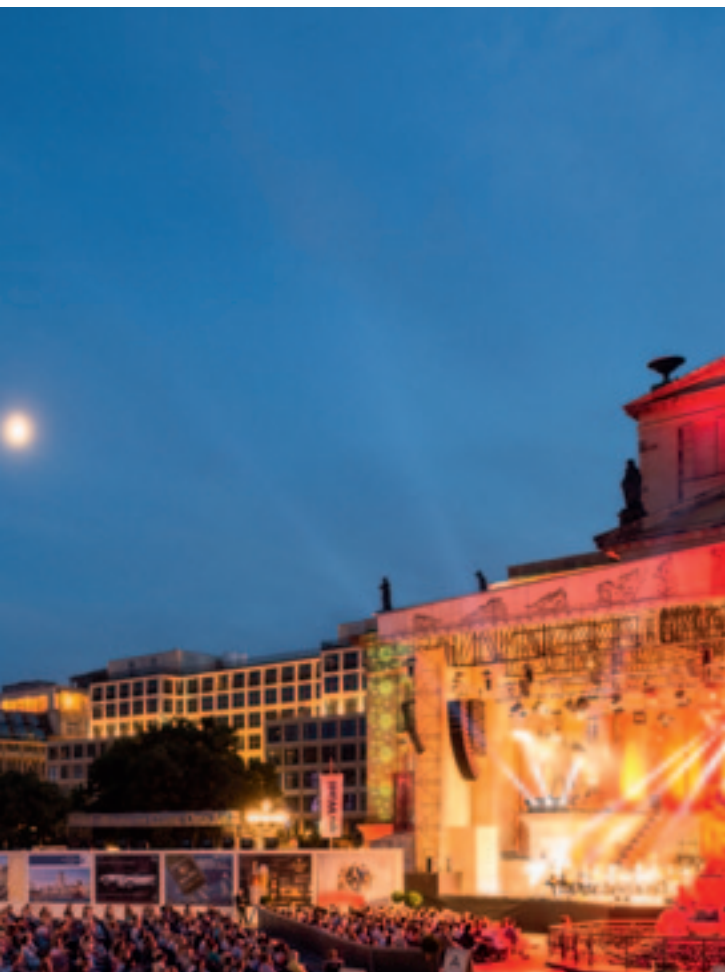
Le Deutscher Dom, sur le Gendarmenmarkt à Berlin, illuminé lors du 23e Classic Oper Air Festival, en juillet 2014.