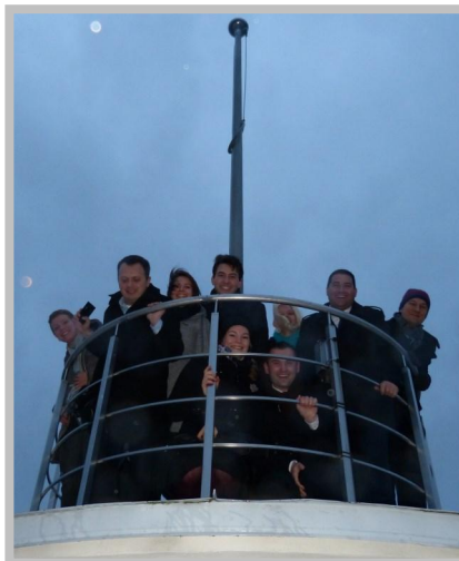
Der Flaggenturm Pikk Hermann

nicht. Wir hatten einen wunderschönen sonnigen und historischen Rundgang in der zum UNESCO-Weltkulturerbe gekrönten Altstadt Tallinns.