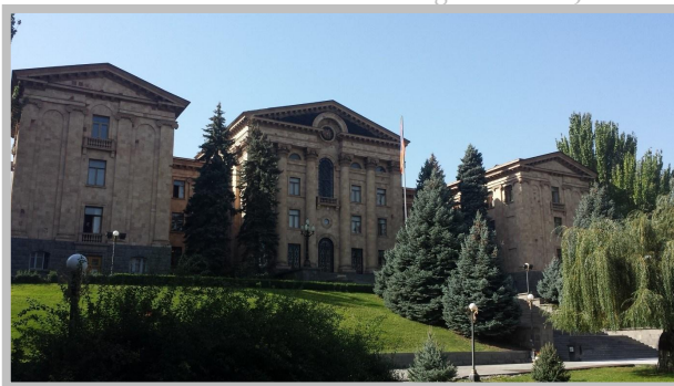
Das Parlamentsgebäude in Jerewan

des Ausschusses für auswärtige Angelegenheiten. Der Ausschuss beschäftigt sich mit allen Fragen der auswärtigen Zusammenarbeit und war sehr spannend und lehrreich für mich. Die Hauptarbeitsprache ist Armenisch, allerdings konnte ich auf Englisch gut mitarbeiten. Meine Aufgaben bestanden darin, Berichte und Einschätzungen zu aktuellen Vorgängen und insbesondere zur europäischen und deutschen Sichtweise zu verfassen. Neben diesen Tätigkeiten war ich eingeladen, an vielen Veranstaltungen wie Treffen zwischen deutschen und armenischen Parlamentariern, dem Empfang der deutschen Botschaft am 3. Oktober sowie den Parlaments-sitzungen teilzunehmen.