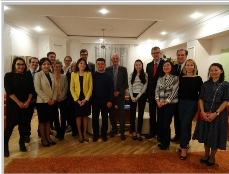
Auf dem IPS- Empfang in Astana, Kasachstan

Auswahlreise der IPS-Delegation des Deutschen Bundestages nach Kasachstan