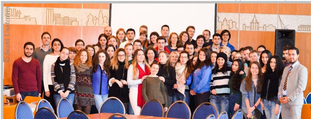
Gruppe A im Teikyo-Hotel

zum Feiern und alle haben den Abend richtig genossen. Langsam waren wir am Ende des Seminars für Gruppe A und es kam die Zeit, in der auch die Gruppe B ihre Spuren im Teikyō-Hotel hinterlassen sollte. Für eine kurze Zeit waren die beiden Gruppen zusammen und diese Gelegenheit wurde von den Mitgliedern des Referates WI 4 genutzt, sich kurz vorzustellen und sich mit den Stipendiaten auszutauschen. Das Seminar war beendet aber somit nicht die Leidenschaft und die Energie der Stipendiaten, die mit voller Kraft an die kommenden Herausforderungen gedacht haben. Dieses erste Einführungsseminar diente zwar zur Verbesserung und Verstärkung der Kontakte zwischen den Stipendiaten, hatte aber auch definitiv enorme Schulungsziele. Die neue Erfahrung und das neu gewonnene Wissen werden dazu beitragen, dass wir uns wünschen können, mit offenen Augen durch die Welt zu gehen. „Menschen, welche mit offenen Augen durch die Welt gehen, sind sehr selten, und das ist schade. Denn nur mit offenen Augen sind wir bereit, auch ihre Schönheit zu sehen.“ ■