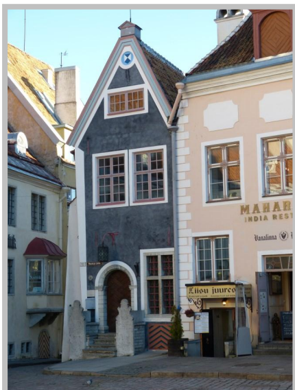
Das UNESCO Weltkulturerbe Estlands - die tallinner Altstadt

Die Konferenz sollte jedoch nicht eine Angeberei von Seiten Estlands sein, sondern vielmehr als Plattform zum Ideenaustausch dienen. Es war höchst interessant zu hören, was die Teilnehmerländer über ihre IT-Anwendungen berichtet haben. Das ähnlichste System gibt es wahrscheinlich in Georgien. Den Personalausweis (ID-Karte) kann man dort wie in Estland benutzen, jedoch ist es noch keine Pflicht. Man kann sich damit auf Flüge registrieren, Firmen gründen und auch die Arbeitsdauer wird damit kontrolliert. In der Ukraine hat man z.B. vor kurzem online ein Grundeigentumsregister eingeführt, was einem ermöglicht, die Anzahl der Grundstücke von Beamten zu verfolgen. Während der Regierung Medwedjews gab es die Initiative, dass Bürger selbst Gesetze in Russland schreiben und über sie abstimmen können. Neben vielen innovativen Lösungen existiert jedoch auch eine Liste von verbotenen Internetseiten.