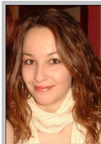
© Martina Karapanou von Martina Karapanou, Griechenland

Berichte der Stipendiaten des Jahrgangs 2016