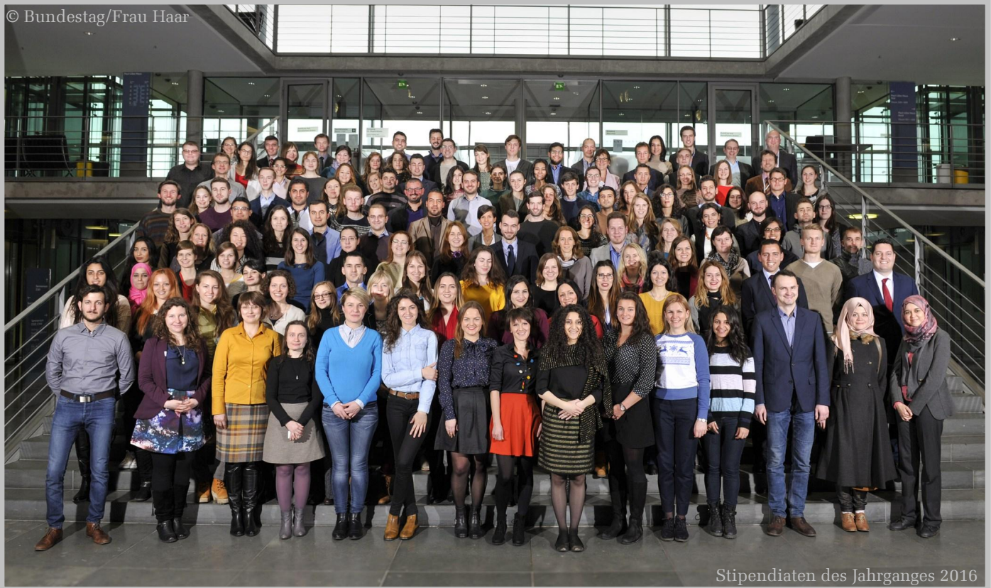
Stipendiaten des Jahrganges 2016