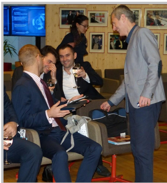
Alumni lernen sich kennen und schließen Freundschaften

Ich hatte ja schon angedeutet, dass das kleine Estland ziemlich weit im Bereich der Digitalisierung ist.