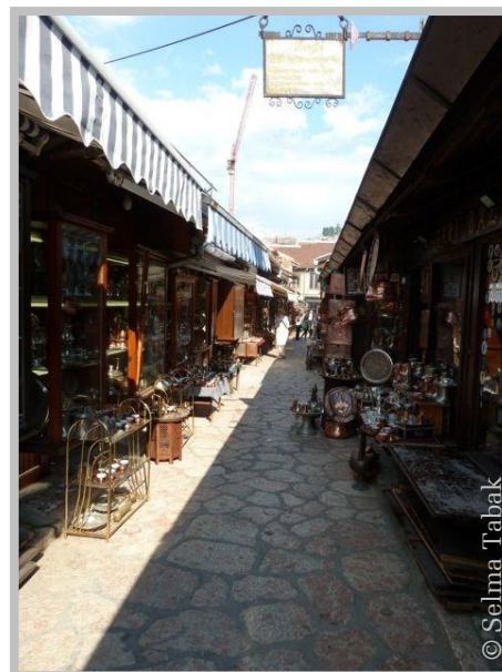
Markt in Sarajewo

Nach meinem Besuch zu Hause rede ich erstmal mit einer viel höheren Lautstärke als sonst, was die Deutschen nicht gewöhnt sind. Lautes Sprechen und starke Gestikulation sind ein Teil der bosnisch-herzegowinischen Kultur. Die Deutschen hingegen reden leiser und ruhiger. Ich erlebe es jedes Jahr mehrmals und ich muss mich jedes Mal aufs Neue umstellen. Die ersten Tage in Sarajewo habe ich das Gefühl als ob mich alle anschreien, wiederum, wenn ich nach Berlin zurückkomme, flüstern alle und ich kann sie nicht verstehen. Dies kann sowohl lustig als auch unangenehm sein. ■