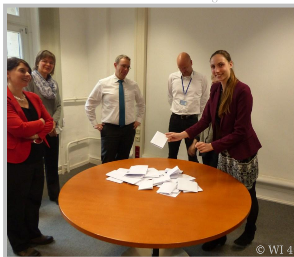
IPS-Team bei der Ziehung des Gewinners

Einfach das Formular auf der IPS-Homepage herunterladen und an ips@bundestag.de schicken. ■