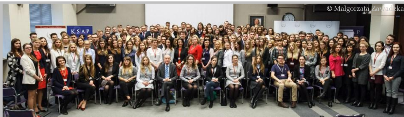
Teilnehmer der Europäischen Akademie der Diplomatie in Warschau

Auch sehe ich im Stipendium eine tolle Chance, meine politischen und sozio-kulturellen Kompetenzen zu erweitern, neue Freunde aus der ganzen Welt zu treffen und den interkulturellen Austausch zu machen, weil ich auch kulturell sehr interessiert bin. Ich glaube, dass meine Offenheit und positive Einstellung sowie die Freude an neuen Herausforderungen und dem ausgeprägten Interesse an der Zusammenarbeit zwischen Staaten für die Arbeit des IPS eine Bereicherung darstellen. ■